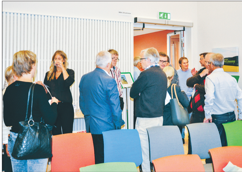
Lite trivsamt mingel före lunchmötet gav en bra chans att träffa kollegor och hålla sig uppdaterad om vad som händer i olika branscher.